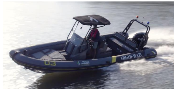
Test d'un des premiers semi-rigides Highfield – Suzuki 2022 le 14 juin, au large de Brest

Cinq bateaux à l'essai : Highfield 900 DF300BTXX, Highfield 760 DF300APX, Highfield 700 DF200APX, Highfield 660 DF150APX, Highfield 600 DF1140BGTX.