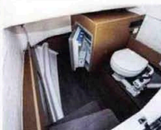
L'abri de console peut renfermer un wc marin ainsi qu'un réfrigérateur.