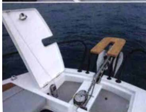
Signe du caractère marin du bateau, la baïlle à mouillage affiche des dimensions généreuses.