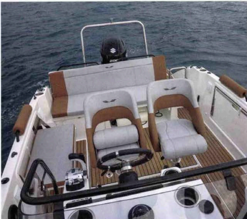
Le cockpit est sécurisant avec des hauts pavois (0,70 m) et dispose d'un équipement confortable, tout en offrant un bel espace grâce aux deux banquettes latérales escamotables.

portement sûr et sain. Plein gaz, les sauts de vagues s'enchainent pour des retombées en douceur. En revanche dès que l'on accélère franchement, la barre devient très dure malgré la direction hydraulique. Cela ne nous empêchera pas de prendre des virages serrés, même à grande vitesse, pour constater que le bateau reste à plat et ne décroche pas. En prime, on constate que la déflexion est excellente car aucune goutte d'eau n'est venue sur le pont durant tout notre essai. En bref, un bateau que l'on peut vraiment mettre entre toutes les mains... ■