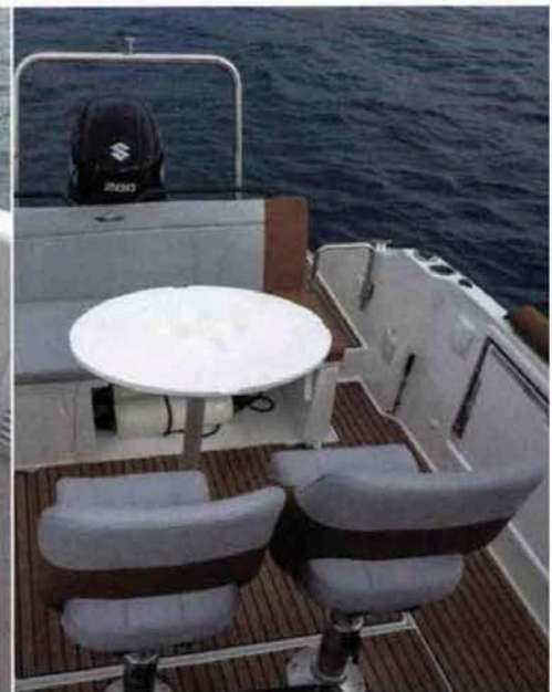
Les deux sièges bolster de la console pivotent sur 360° pour compléter les assises autour de la table du cockpit.