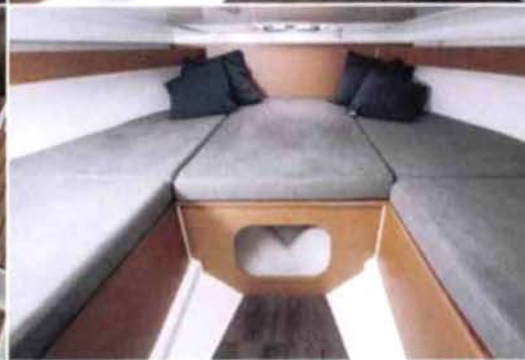
Avec l'extension centrale, la cabine offre un couchage de 2,18 x 1,80 m, idéal pour un week-end.