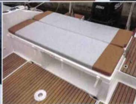
Le dossier de la banquette arrière bascule pour former un petit bain de soleil. Simplissime...