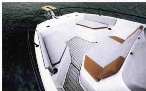
Le pont avant présente également un salon dans lequel 6 invités peuvent s'installer. Il s'avère évidemment modulable en bain de soleil si besoin.