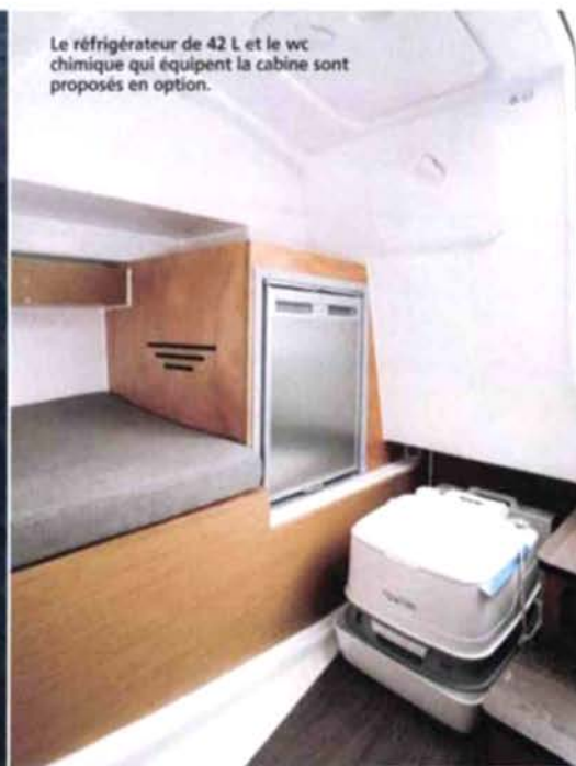
Le réfrigérateur de 42 L et le wc chimique qui équipent la cabine sont proposés en option.