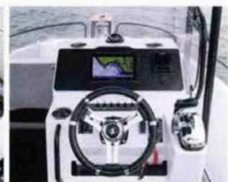
Modèle du genre, le tableau de bord offre tout le nécessaire, on aime !