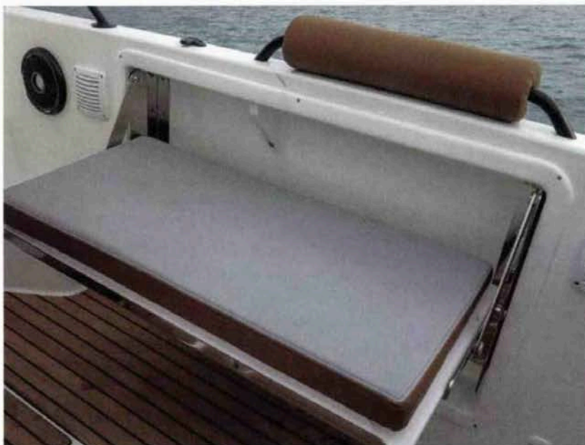
Au niveau de la banquette, la main-courante est entourée d'un coussin qui sert de dossier pour le confort du passager assis ici, mais qui la rend aussi inopérante pour remplir sa mission première.