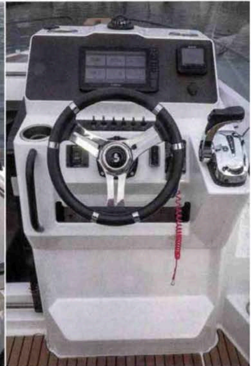
Le poste de pilotage se révèle complet et ergonomique, avec tout disposé à portée de main et bien visible.