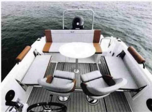
Voilà ce que l'on peut appeler un salon convivial pour un open de 6,13 m de coque.